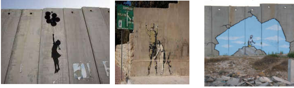
شكل (14) بانكسي، 2015. قضايا من فلسطين، ستنسل. https://www.instagram.com/banksy/

من لوحات الجرافيتي للفنان بانكسي، نفذها على الجدار العازل في فلسطين (2015) الشكل (14).