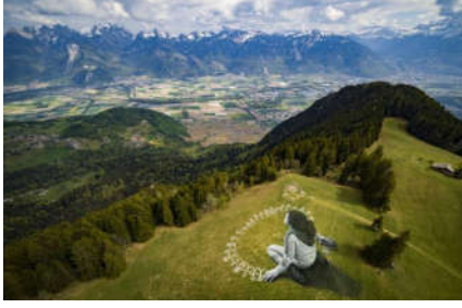
شكل (13) ألم ما بعد الأزمة، للفنان سايبى، 2020. جبال الألب، سويسرا، 3000 متر مربع، دهانات حيوية، الفحم والطباشير. https://www.graffitistreet.com

كان للفن الجرافيتي المعاصر استجابة سريعة لجائحة كورونا. ان تظهر العديد من الأعمال الجرافيتية تبعاً في جميع أنحاء العالم اثناء الجائحة.