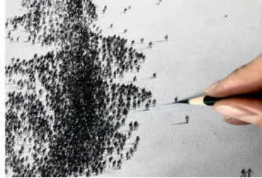
شكل (23) العينة (5) القوة في التباعد الاجتماعي الفنان بيجاك، 2020م، اسبانيا. المستشفى الجامعي ماركيز دي فالديسيلا في سانتاندر. أقلام الرصاص والفحم.

رسم الفنان بيجاك على أحد جدران المبنى شرخاً طويلاً يمتد من أعلى الجدار حتى نهايته للأسفل، باللونين الأبيض والأسود. عندما نأخذ مقطعاً أقرب للوحة نجد أن هذا الشرخ قد تكون من عدد هائل من الحشود البشرية متعددة الفئات العمرية، بين نساء ورجال وأطفال، والتي تركزت في المنتصف فيظهر الشرخ أعمق وأشد. وكلما كانت أبعد عن المركز قلت حدة التصدع هكذا حتى يختفي التصدع في الجدار في الأطراف البعيدة.