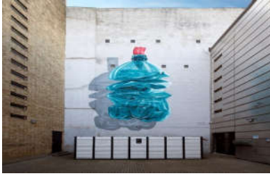
شكل (16) آلة استنزاف "I" فانكور، كاليفورنيا، للفنانين: Rebech, Pablo Tongi 2016. https://www.instagram.com/p/BJ