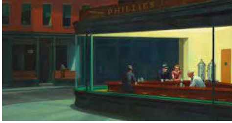
شكل (8). العشاء الليلي، ادوارد هوبر، 1941. www.cell.com

كان الجدري في القرن الثامن عشر في يوم من الأيام مرضاً وبائياً شائعاً يقتل أو يصيب بالعمى، لقد تم تقليل تأثيره في أوروبا من خلال ممارسة صينية تسمى التجدير، وهي حقن سائل إنسان مصاب بجسم آخر سليم، وفي عام 1798، اقترح الطبيب الإنجليزي إدوارد جينر تعديلاً أكثر أماناً للتجدير يسمى التطعيم، والذي يتضمن حقن سوائل من بثور بقرة مصابة إلى البشر. وبعد سنوات من الملاحظة والتجارب أجرى إدوارد تجاربه حول تأثير اللقاح على الأشخاص في عام 1796م، حيث قام بتلقيح جدرى البقر في نراع السيدة ساره نيلمز وطفلها فيبس. هذه اللحظات قام الفنان أوجين هيلماخر (Eugene Hillemahe) 1818-1887م بتوثيقها بلوحة بعنوان (إدوارد جينر يلحق طفل) الشكل (9)، 1884 (Pordo, 2018). كما قام الفنان الأسباني فيسنتي اييلا (Vicenti Aella 1867-1945) برسم لوحة بعنوان (تطعيم الأطفال) الشكل (10)، يقوم الطبيب بتلقيح طفل تحمله والدته، وعلى يمينها العديد من الأطفال العراة تحملهم أمهاتهم ينتظرون دورهم لتلقي اللقاح. إحدى الأمهات تبدو بملابس فاخرة ترتدي المجوهرات، بخلاف الأمهات الأخريات اللاتي يبدو انهن من طبقة متواضعة، هذه الإشارة من الفنان للدلالة على أن لا عوائق اجتماعية تمنع من تلقي اللقاح لأن الوباء لا يفرق بين طبقات المجتمع. وأن الجميع لديهم مصلحة مشتركة وهي التخلص من الوباء (Donoso, Arriagada, 2019).