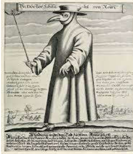
شكل (11). قناع طبيب الطاعون، للفنان باولوس فورست، 1650م.

(Paulus Furst, 1608-1666) بلوحة بعنوان (قناع طبيب الطاعون) 1650م الشكل (11). وقد انتشر هذا الزي لاحقاً كملصق للتوعية من خطر العديد من الأوبئة. (Prado, 2018)