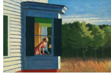
شكل (6). سيدة تنظر إلى الخليج، ادوارد هوبر، 1950 شكل (7). كرسي السيارة، ادوارد هوبر، 1965. www.cell.com www.cell.com