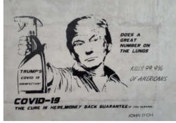
شكل (18) مطهر ترامب للقضاء على فيروس كوفيد-19، للفنان جون دو، على جدران مدينة بريستول البريطانية، https://www.inspiringcity.com/2020/05/01/satirical-coronavirus-streetart-from-john-doh

قام الفنان البريطاني جون دو (John D'oh) برسم عدد من لوحات الجرافيتي منذ تفشي الجائحة في بريطانيا، رداً على الإجراءات الحكومية في جميع أنحاء العالم. منها لوحة بعنوان (مطهر ترامب للقضاء على فيروس كوفيد-19)، بعد تصريح الرئيس الأمريكي ترمب (Trumb) بأن يتم مكافحة الفيروس بحقن الناس بالمنظفات. ليظهر ترامب في إعلان للترويج للمطهر على جدران مدينة بريستول البريطانية حاملاً علبة المعطر تحيط به عبارات ترويجية تهكمية كتبها الفنان إشارة إلى أن قرارات ترامب بشأن مكافحة جائحة كورونا، ستقتل الشعب الأمريكي الشكل (18)، (John, 2020).