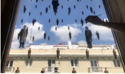
شكل (24) العيونة (6) البقاء في المنزل، بيجالك، 2020م، اسبانيا، نافذة أحد المصانع ألوان الرسم على الزجاج، المصدر: https://nstagram.com/pejac?utm_medium=copy_link

رسم الفنان على نافذة تطل على حي سكني، رجالا بملابس سوداء وقبعات بأعداد كثيرة. كما أنهم يرتدون أقنعة على وجوههم. لا يتحركون يتجهون نحو الأرض لكنهم ينظرون باتجاهات مختلفة. يبدو وكأنهم سقطوا من السماء، فبعضهم لا يزال بين الغيوم بعيداً والبعض اقترب من أسطح المنازل بينما تظهر رؤوس آخرين يبدو أنهم قد اقتربوا من سطح الأرض. في الخلف يوجد مبانٍ سكنية، بنوافذ كثيرة بعضها محاط بقضبان حديدية. ومن خلف المباني تبدو السماء صافية تغطيها بعض الغيوم غير الماطرة.