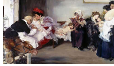
شكل (10). تطعيم الأطفال، 1900م، فينست، برادو. 150×100م. زيت على قماش.