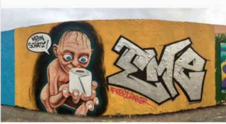
شكل (21) العينة (3) بلدي الثمين. الفنان ايمي فريثنكر، 2020، ألوان اكريليك. بتقنية الاستنسل المانيا برلين.