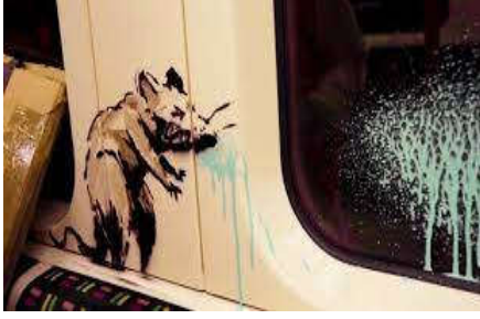
شكل (20) العينة (2) فئران تنشر الوباء، الفنان بانكسي، ألوان الرزاند، بالاستنسل. مترو أنفاق لندن.

رسم الفنان هذا العمل على الجدران الداخلية لمترو الأنفاق. حيث تظهر مقاعد الركاب، خلفها فأر يبدو مريضاً ويعطس على الجدار وينتشر رزانه على النافذة. ومن الجدير بالذكر أن الفنان بانكسي قد استخدم الفأر كعنصر وحيد في كثير من لوحاته في عدد من المواضيع التي تطرق إليها في هذا المشهد الذي يثير اشمئزاز الركاب للوهلة الأولى، إنما هو في الحقيقة يؤكد على أن فيروس كورونا موجود بكل مكان من حولنا. وقد يكون بين الركاب وعلى المقاعد والنوافذ. فلا بد من الالتزام بالتباعد المكاني بين ركاب المترو وارتداء الكمامة والمحافظة على التعقيم. إلى جانب هذا الفأر رسم الفنان مجموعة من الفئران داخل المترو تشير الفوضى وتنازع بالكمادات، وأخرى تستخدم زجاجة المعقم؛ لمزيد من التأكيد على إجراءات السلامة داخل المترو وخارجه. قام الفنان بنشر فيديو لنفسه وهو يقوم بارتداء ملابس خاصة وقناع دون أن تظهر ملامحه. من ثم طلب من الركاب الابتعاد ليقوم بالرش وطباعة الاستنسل داخل المترو. ليؤكد انه من قام بذلك. ليقوم عمال النظافة صبيحة اليوم التالي بتنظيف الجدار وفقاً لسلطة النقل في لندن، لعدم معرفتهم بأنها لوحات تحذيرية للفنان بانكسي وليست عملاً تخريبياً. كما ويأتي هذا العمل في الوقت الذي تراجعت فيه الحكومة البريطانية نهائياً وإياباً في نهجها لجعل تغطية الوجه في الأماكن العامة إلزامياً (Romero, 2021).