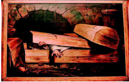
شكل (2)، الدفن قبل الاوان، 1854م، زيت على قماش، متحف بيرتر بروكسيل، https://www.ncbi.nlm.nih.gov

لقد تسبب وباء الكوليرا عام 1820م في مقتل الآف الأشخاص في أوروبا وأمريكا الشمالية. كما خلف حالة من الذعر الجماعي عبر القارتين، مما دفع ما يقارب نصف سكان مدينة نيويورك للفرار إلى الأرياف (Mcnamara, 2020). على الرغم من إنكارهم لوجود الوباء في بداية انتشاره واتهام الأطباء باستغلال الناس وتضليلهم للحصول على المال مقابل العلاج، وعدم ثقة الجمهور بالطب وقدرته على التشخيص الصحيح للكوليرا والهجمات السياسية على سياسة الحكومة في مكافحة الوباء. انعكس ذلك على الأعمال الفنية في تلك الفترة، حيث امتازت بالدعابة والخوف معا إذ برز الخلاف بين الأطباء والمرضى في كثير من الرسوم الكاريكاتيرية كملصقات في المجلات. من أشهرها ملصق يظهر طبيب الكوليرا روبرت كروكشانك (Robert, Cruikshank) يجلس على مائدة وأمامه أطباق الطعام المملوءة بالنقود، للدلالة على الثراء الفاحش الذي جناه من مرضى الوباء. أما في بريطانيا كان القلق إضافي من خطر الدفن المبكر للحالات الخطرة والشديدة. ليصبح اشتراط الدفن السريع من قبل الحكومة مشهد درامي في الأعمال الفنية. كلوحة الفنان أنطوان جوزيف (Antoine-Joseph Wiertz) 1853م (الدفن قبل الأوان) يظهر المريض في تابوت ويخرج يده طالبا المساعدة لإخراجه ويصرخ خوفاً، في قلب هذا المشهد المرعب ترك الفنان نقشاً يثير الفكاهاة الى جانب التابوت (الموت من الكوليرا - مصدق من قبل أطبائنا دون شك) الشكل (2) مزج الخوف والفكاهاة، توضح اللوحة بقوة (دون شك) أن الضحية التعيسة قد دفنت حية (Park, 2010).