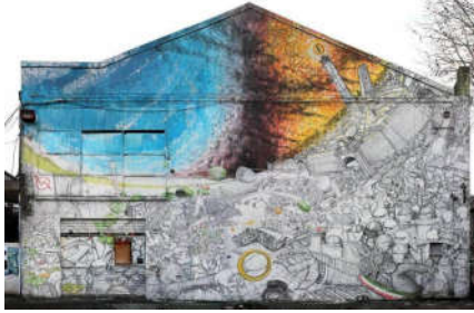
شكل (15) بلو، بولينا، إيطاليا، 2013. 4م https://www.graffitistreet.com * 4م.

بنى الفنان الإيطالي بلو (Blu) سمعة قوية في فن الجرافيتي المعاصر، من خلال لوحات رسمها على جدران كبيرة جداً، قام بإنشائها حول العالم. من برلين إلى روما ومن أثينا إلى ريو دي جانيرو، غالباً ما يكون محتواه مخصصاً لتمرير رسائل اجتماعية أو سياسية تهم القضايا المحلية أو الدولية البارزة. لقد قدمت بساطته وأسلوبه الخيالي نجاحاً كبيراً بابتكاره لتقنيات جديدة في فن الجرافيتي. حيث تنتشر جدرانه في جميع أنحاء العالم وهو بالتأكيد أحد أكثر التمثيلات أصالةً لفن الجرافيتي العالمي اليوم، تاركاً وراءه حقبة خاصة به. كان من أشهر أعماله التي نفذت في بولونيا عام 2013م بمساحة 24م × 24م على جدار مبنى. مستوحى من سيد الخواتم الشكل (15). رسمها من أجل حركات السلام ومناهضة الفاشية. وعند إلقاء نظرة فاحصة للجدار يمكننا أن نرى شخصيات متنوعة من حرب النجوم Star Wars ( ) و Storm troopers) وحتى شخصيات بشرية وأشجار جميعها تقاتل من أجل الحصول على الخاتم. وعلى يمين الجدار نرى هذه الشخصيات تقاوم وتدافع عن أرضها وتقاتل الجرافات بالبطبخ مما يمثل معركة سلمية (Donna, 2016).