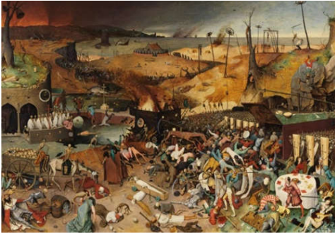
شكل (1)، بيتر بروغيل، انتصار الموت، 117×162سم، زيت على

حرص كبار الفنانين في تلك الأثناء على إنجاز أعمال فنية بقيت خالدة ليومنا هذا، اعتبرت إيقونات وثقوا من خلال مشاهداتهم ومعايشتهم لتلك الأوبئة ومعاناة البشرية في حينها. ففي منتصف القرن السادس عشر ظهرت لوحة بمشهد درامي للموت بعنوان (انتصار الموت) الشكل (1) للفنان الهولندي بيتر بروغيل (Bruegel) (1525-1569)، يظهر بها جيش من الهياكل العظمية التي تشق الطريق بين الناس وتقتلهم بلا رحمة. إذ تصنف هذه اللوحة على أنها من أفزع الصور التي صورت المأساة ومشهد الموت في تاريخ الفن التشكيلي.