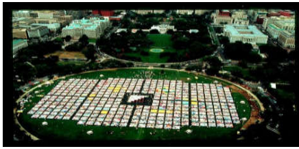
شكل (4). لحاف الإيدز المتنقل. واشنطن 2012م www.traasgpu.com

بحثت سوزي فريزر في الممارسات الفنية في القرن العشرين خلال انتشار وباء الإيدز. الذي ظهر في أوائل الثمانينيات من القرن الماضي، كداء غامض. وما أن تظهر أعراض المرض على المصاب حتى يوصم بوصمة العار. كذلك الحال بالنسبة للفنانين، إذ أصبح توثيق أعراض المرض أو المصابين عملاً سياسياً بحد ذاته. حاول الفن في ذلك الوقت أن يخلق مجتمعا خاصا للمصابين والمتعافين من هذا الوباء وتوفير الشعور بالراحة والتعاطف فكان من أوائل الأعمال الفنية عمل تعاوني يحتوي مجموعة كبيرة من اللوحات والتصاميم الفنية التي تنشر الوعي المجتمعي بمخاطر مرض الإيدز وهو نصب تذكاري بعنوان (لحاف الإيدز) الشكل رقم (4) بتنسيق من الناشط الاجتماعي كليف جونز (Cleve Jones, 1954)، في سان فرانسيسكو عام 1985م. ولا يزال قائماً ليومنا هذا. حيث يقام في عدة مدن، ويتم الاحتفال بمحيطه ب حياة الناجين من الوباء وكذلك دعماً للمصابين. تعتبر هذه الاستجابة الفنية الجماعية محاولة للسيطرة على الخطاب العام للمرض وتقديم شعور عام بالقبول والراحة للمصابين (Fraser, 2020).