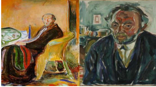
شكل(3). على اليسار، "صورة ذاتية مع الأنفلونزا الإسبانية" (1919)، 29×59سم، زيت على قماش. على اليمين 'صورة ذاتية بعد الأنفلونزا الإسبانية' (1919)، 29×23سم زيت على قماش. https://verne.elpais.com

(Edward Munch, 1863-1944) كانت كافية لترجمة الصدمة الشخصية والألم الجسدي والنفسي الذي واجهه المصاب، إذ أصيب الفنان مونتش بالأنفلونزا الإسبانية وهو في السادسة والخمسين من عمره. فرسم مراحل الإصابة بمرحلتين: الأولى اثناء المرض بعنوان (بوتريه مع الأنفلونزا الإسبانية) الشكل(3) وحيدا معزولا يجلس على كرسي يلتحف بطانية المرض، يبدو هزيلا وجهه شاحب اللون يحدق بعينيه المليئتتين بالخوف والارتباك والثانية بعد التعافي مع بقاء بعض آثار المرض، بعنوان (بوتريه بعد الأنفلونزا الإسبانية) إذ يظهر واقفا على قدميه في إشارة الى التعافي، كما تغير لون وجهه الى اللون الأحمر لزوال الشحوب وتراجع الفيروس، لكن بقي انتفاخ عينية يدل على التعب والأرق (Goldstein, 2020).