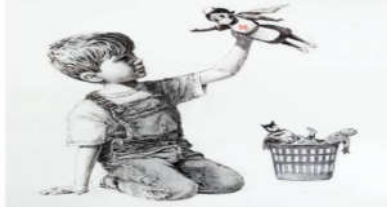
شكل (12). الفنان بانكسي. اللعبة الخارقة، زيت على قماش، 100×100سم، 2020.

برزت الكثير من الأعمال الفنية التي تشكل دعماً لمقدي الرعاية الصحية والمصابين، لرفع الطاقة الإيجابية لديهم ولأفراد المجتمع وتقديم الدعم المعنوي والتوعوي. فتحوّلت النوافذ والشرفات إلى لوحات فنية عبر من خلالها الفنانون عن رؤيتهم ومحاولاتهم لتقديم حلول الخلاص من الأزمة والتخفيف من الضغوطات التي يتعرض لها أفراد المجتمعات عالمياً. على الرغم من عزلتهم وتباعدهم الاجتماعي اللذين فرضتهما الجائحة. إلا أن الحجر المنزلي قد أتاح الفرصة لبعض الفنانين لقضاء وقت أطول لإنجاز المزيد من الأعمال الفنية، برؤى جديدة تحاكي الواقع. حيث قام فنان الجرافيتي بانكسي (Banksy) بتقديم تحية للطواقم الطبية التي تتصدى لجائحة كورونا في إنجلترا ثاني أكثر الدول تأثراً بالجائحة من خلال لوحة أحادية اللون، عنوانها (Game Changer) الشكل (12)، والتي يظهر فيها طفل يجلس بجانبه سلة بها ألعاب مفضلة لدى الأطفال، لشخصيات كرتونية خارقة، إلا أن الطفل يحمل بيده دمية لممرضة، برزي التمريض مرسوم عليه شعار الصليب الأحمر وهو اللون الوحيد في اللوحة بغير الأسود والأبيض، ترتدي قناعاً واقياً للوجه وتمد ذراعها إشارة لفعلها الخارق وقوتها. كما كتب الفنان رسالة إلى الطواقم العاملة في المستشفيات: "شكراً لكل ما تقومون به. أمل بأن يضيفي هذا العمل بعض النور على المكان مع أنه بالأسود والأبيض فقط" وقد علق العمل على جدار ممر في مستشفى ساوثمبتون في جنوب إنجلترا على أن يعرض بشكل علني ما إن ترفع إجراءات العزل (Gompetz, 2020).