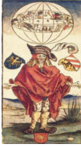
شكل (5). الرجل المصاب. البريخت دورر، 1490م، نقش على خشب. (Lacombe, 2008)

كما أشار إلى ذلك لاقومب (Lacombe, 2008) وأكده كلُّ من بارمان كوروز (Barman Curoze)، رافائيل برادو (R. Prado) وجابريل باجيل (Gabriel Pagel) في أبحاثهم في الأمراض المعدية في الفن (2018م)، بأن الفنان دروير قد قام بتسجيل دخول مرض الزهري الى أوروبا في القرن الخامس عشر. في لوحة يتوسطها، وقد شوه المرض جسده وفوق رأسه كرة من الكواكب والأبراج السماوية المعلقة، كتحذير لما سيحل بمن يتجاهلون قدرة النجوم والكواكب. ظهر في العمل بعض النقوش التي ترمز للاقتران النجمي الذي كان يعتقد بأنه السبب في ظهور مرض جديد عام 1484م. ثم تم التعرف في علم الأمراض على مرض جديد في نهاية القرن الخامس عشر، لم يكن قد تم اكتشافه وتشخيصه سابقا، وهو (مرض الزهري). حين نشر الدكتور (اولسينيوس) وهو طبيب وعالم فلك أنه تم اكتشاف مرض جديد في أوروبا، ولأول مرة في علم الأمراض اسمه الزهري. حيث قام بإجراء عمليات حسابية فلكية في علم الفلك والتنجيم، ليتوصل إلى الاقتران النجمي بين كوكب المشتري وزحل في برج العقرب والذي حدث العام الذي رسم فيه الفنان دروير لوحته وظهرت بها رموز هذا الاقتران وعلامات المرض على جسده الشكل (5) (Prado, 2018). ففي بعض الأحيان تكتسب الأعمال الفنية قيمة وثائقية بمرور الوقت (Mazza,2020).