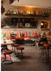
صورة (9): توضح النمط البوهيمي في التصميم الداخلي لأحد البيئات السكنية .

ثقافات البلدان المختلفة مع بعضها البعض بأسلوب عملي وجمالي ذي بعد تصميمي أخاذ، كمزج قطع من الديكور الهندي على سبيل المثال مع قطع من الديكور العربي بأسلوب وظيفي وجمالي يعزز من جودة التصميم الداخلي على جميع الصعد. باختصار، يعد النمط البوهيمي من الأنماط المفعمة بالحركة والمجردة تماماً من أية قيود تصميمية تعطي الفراغ طابعا تقليديا وتسبب شعورا بالملل داخل الفضاء، مما يقلل من جودة التصميم الداخلي بشكل عام ويهبط من كفاءة الفضاء الداخلي (انظر صورة: 9).