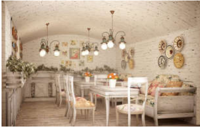
صورة (7): توضيح نمط الشابي شيك في التصميم الداخلي الحديث www.images-wixmp.com

بدأ نمط الشابي شيك في بريطانيا عام 1980، ويعتبر من أنماط التصميم الداخلي الحديث الذي يتميز برونق وذوق خاص، حيث يستمد هذا النمط فكرته التصميمية من خلال الأثاث العتيق والذي يعتقد في بعض الأحيان أنه يقلل من جمالية الفراغ الداخلي، إلا أن الأسلوب المستخدم من قبل المصمم الداخلي والذي يعتمد على مزج الأثاث والعناصر التصميمية القديمة والديكورات العتيقة ودمجها مع الأسلوب المعاصر بطريقة تصميمية ذكية يمنح التصميم الداخلي نوعاً من التميز والاختلاف واللمسات الجمالية البسيطة البعيدة عن الطابع التقليدي المستخدم في بعض الأنماط التصميمية (انظر صورة: 7).