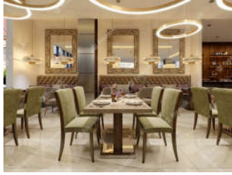
صورة (13): توضح النمط العصري الحديث في التصميم الداخلي الحديث www.image.freepik.com

يعرف النمط العصري في التصميم الداخلي الحديث بالبساطة المفرطة والهدوء والوظيفية بشكل كبير، فهو يعتبر من الأنماط المثالية جداً للأفراد الذين يسعون إلى إنشاء بيئة داخلية ذات وظيفية عالية، بالاعتماد على الحيل التصميمية التي تسهل على الأفراد تأدية وظائفهم أثناء تواجدهم ضمن الفراغ الداخلي، كما يعتمد النمط العصري على استخدام الألوان البسيطة والحيادية، وفي أغلب الأحيان لا يتم استخدام أكثر من لونين أساسيين في تصميم الفراغ الداخلي العصري، مع ميل تصميمات الجدران إلى الألوان الفاتحة والحيادية. كما يناسب تصميم النمط العصري الحديث الفراغات الداخلية ذات المساحة الضيقة بسبب بساطة التفاصيل التي تعطي انطباعاً أن المساحة الداخلية تبدو أكبر. باختصار، يعتبر النمط العصري الحديث نمطاً مثالياً جداً لمحبي الهدوء والبساطة والحياة العملية ذات الكفاءة الوظيفية (انظر صورة: 13).