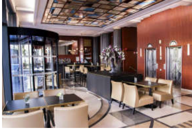
صورة (11): توضح نمط الأرت ديكو في التصميم الداخلي الحديث

يعد نمط الأرت ديكو من نظريات الاتجاه الحديث في التصميم الداخلي، حيث يمتاز هذا النمط بأسلوبه التصميمي الذي يعتمد على التطبيق العصري للعناصر التصميمية المختلفة في الفراغ الداخلي، والروح الانتقائية التي تجمع بين مكونات الفضاء الداخلي بأسلوب إبداعي يعكس فخامة وتقدم الزمن المعاصر، كما يجمع نمط الألات ديكو بين اللمسات الفنية المختلفة معاً ليشكل مزيجاً راقياً ومميزاً مثالياً لمحبي الترف والفخامة (انظر صورة: 11).