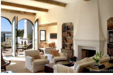
صورة (10): توضح نمط البحر الأبيض المتوسط في التصميم الداخلي www.roomester.com