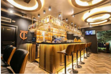
صورة (4): توضح النمط الكلاسيكي في التصميم الداخلي الحديث

النمط الكلاسيكي هو أحد أنماط التصميم الداخلي الحديث المستمد من العصور اليونانية والرومانية القديمة، حيث يعرف هذا النمط بالرفاهية واللمسات المفعممة بالأناقة، ويعتمد بشكل كبير على خلق نوع من التوازن بين التفاصيل المستخدمة في الفراغ الداخلي، ونجد أن هذا النمط أيضاً يستخدم التفاصيل المذهبة والأسطح اللامعة كأساس تصميمي يعتمد عليه. فيما يتعلق بموضوع الألوان فإن هذا النمط يعتمد على الأخضر والأزرق والأحمر الداكن بالإضافة إلى اللون الأسود والذهبي بشكل أساسي، كما يتميز هذا النمط باستخدام المفروشات المخملية والحرير مما يعزز من فخامة وجمالية التصميم، أما تصميم الأرضيات والجدران فيعتمد على البورسلين والسيراميك بشكل أساسي، وفي الجدران يتم استخدام الألوان المحايدة وأوراق الجدران ذات النقشة الكلاسيكية الفاخرة (انظر صورة: 4).