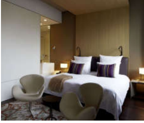
صورة (8): توضح جمالية استخدام النمط التبسيطي في التصميم الداخلي الحديث

يعرف الأسلوب التبسيطي أو المينيمال في التصميم الداخلي الحديث بأنه ذلك النمط الذي يعتمد على اللمسات الديكورية الهادئة، ويتميز بتطبيق نظرية (الأقل) حيث يتم تحقيق ذلك بشكل أساسي بالاعتماد على استخدام قطع الأثاث ذات الوظيفية والأشكال الهندسية والديكورات التي لا تزيد عادة عن لونين أساسيين، ويعتبر من الأنماط التي تنبض بالبساطة والجمال والتي تضيف على الفراغ الداخلي نوعاً من الرقي الخاص لما يتميز به هذا النمط من خطوط عريضة وبسيطة، بالإضافة إلى قدرته على إضفاء مزيج من الراحة والحداثة في تصميم البيئة الداخلية، كما يعتمد هذا النمط على استخدام الألوان المحايدة كالأبيض أو الأبيض أو الرمادي أو العاجي، بحيث تعبر جميع هذه الألوان بشكل أساسي على البساطة، مع استغلال عناصر تصميمية أخرى كالإضاءة واللمسات الديكورية الجمالية ومراعاة أن تكون متناعمة مع عناصر التصميم الداخلي (انظر صورة: 8).