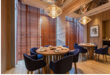
صورة (1): توضيح النمط الياباني في التصميم الداخلي الحديث لחד المطاعم. www.img.lovepik.com

يعتبر النمط الياباني من أنماط التصميم الداخلي الحديث. يتميز بتفاصيله المنعشة والمفعمة بالهدوء والحيوية التصميمية، ويعتمد بشكل كبير على الخامات الطبيعية كالخشب وعناصر الحجر في تصميم الفراغ الداخلي. من أهم السمات التي تميز هذا النمط هي فكرة الانفتاح بين التصميم الداخلي للفضاء والطبيعة الخارجية المحيطة، بالإضافة إلى الاستعانة باللمسات الزجاجية الشفافة والأبواب الزجاجية. يعتبر النمط الياباني الخيار الهادئ والأنسب لمحبي الهدوء والتصميم المريح (انظر صورة: 1).