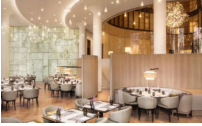
صورة (2): نمط النيو كلاسيك الفاخر في التصميم الحديث

يمكن تلخيص العلاقة التكاملية التي تجمع بين نمط النيو كلاسيك والوظيفية والجمالية في التصميم الداخلي الحديث، كما يلي: