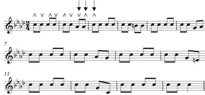
مدونة موسيقية(2): طريقة استخدام الريشة الاقتصادية

3. أساليب الريشة المختلفة، الريشة الاقتصادية: هابطة هابطة (صد صد) في الهبوط من وتر إلى وتر، وصاعدة صاعدة (رد رد) في الصعود من وتر إلى وتر، ويمكن تشبيه طريقة استخدام ريشة العود في الأداء بطريقة استخدام قوس الكمان، حيث أن الريشة المقلوبة تشبه قوس الكمان المفكوك (Staccato)، والريشة الاقتصادية تشبه قوس الكمان المربوط (Legato)، وقد استخدمها منير بشير في مقطوعة الحمراء: