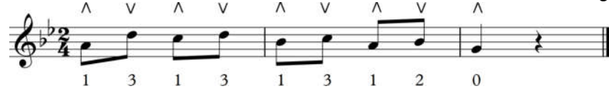
مدونة موسيقية(3): الطريقة الطبيعية لاستخدام الريشة في أداء الزغردة مع الزحلقة

أ. الطريقة الطبيعية لأدائها: كل نغمة بضربة ريشة هابطة ثم صاعدة، ونلاحظ الزحلقة من خلال أرقام الأصابع: