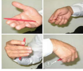
الشكل(1): طريقة الإمساك بريشة العود

2. طريقة استخدام الريشة: من الضروري أن يؤدي الطالب جميع أساليب الريشة، البسيطة والمقلوبة والاقتصادية والفرداش، وذلك عن طريق التدريب عليها خلال مسيرته كطالب إلى أن تصبح جزءاً من ثقافته، لا أن يقوم بحسابها وكتابتها على المدونة الموسيقية، وهناك العديد من التمارين المتعلقة بالريشة وأساليبها المختلفة والتي يمكن الرجوع إليها واستخدامها لهذه الغاية، ويمكن القول بأن أساليب الريشة المختلفة تقوم على المبدأ التالي، إلا في بعض الحالات التي يحددها المؤلف: