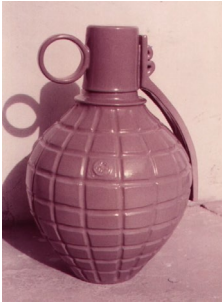
الشكل رقم (4) قنبلة دفاعية، 1983، القياس: 30x50x50 سم، بغداد، فترة الشظية، طريقة الدولاب الكهربائي.

ونلاحظ في الشكل رقم (4) الذي أنجز في فترة سميت بالشظية (Splint) الذي تم بناؤه بطريقة الدولاب الكهربائي، والفكرة كانت أثناء الحرب الإيرانية العراقية، وهي عبارة عن قنبلة يدوية دفاعية محززة بخطوط عريضة هي رمزية للدفاع عن الوطن، والقنبلة غير المحززة الخطوط هي ملساء وهجومية. واستخدم الخزاف طريقة الرش في تزجيج السطح المفخور، لينفذ عملاً بدقة واضحة فيه محاكاة وأظهار قدرة الفنان التعبيرية في إيصال رسالته الفكرية والفنية.