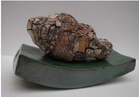
الشكل رقم (7) المنتظم واللامنتظم 2019، القياس: 26x41x26 سم، الفترة الذهبية، الحرق بالغاز 1200 درجة مئوية.

أن كل خاصية بنائية تحدد صفة سطحها وهذه الخاصية تدرك باللمس، ويلاحظ أن العين تشارك في فهمها، لأن السطح الخشن يحدث ظلاً ونوراً، والسطح الأملس معناه فقدان الظل، واللون يختلف تبعاً للسطح الذي يقع عليه. وتختلف السطوح اختلافاً كبيراً فمنها الصلب، واللين، والخشن، والناعم، والحاد، والبارد. (الزيات، 2002: 23).