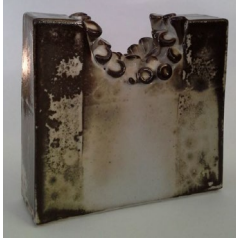
الشكل رقم (8) 2015، تقنية الشينو Shino Technique ، 8 20x20x سم، طريقة الشرائح، 1300 درجة مئوية. فرن غاز.

من تأثير حرق الأخشاب، لكن لها ميزات علمية في طلاءاتها، ودقة نسبة الكربون في الغلاف الجوي (Atmosphere) للفرن، حيث يحتوي الزجاج على نسبة عالية من الصوديوم الذي يذوب على درجات حرارة منخفضة، ثم يتم الاختزال على مراحل ودرجات حرارة مختلفة، وهذا بدوره يؤثر خصوصاً على اللون الأبيض والبنّي والبرتقالي. كما في الشكل رقم (8).